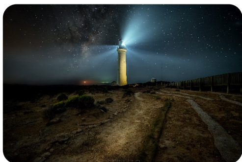
bodový zdroj svetla

3. Svetelné zdroje sa rozlišujú aj podľa plochy ich vyžarovania, resp. podľa toho, aké sa javia človeku z pozorovacej vzdialenosti. Doplň typy zdrojov svetla.