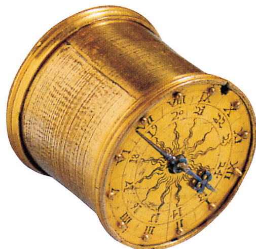
Stolové mechanické hodiny Petra Henleina z roku 1510

Na obrázku vidíte sviecu, ktorá je označená čiernymi zárezmi. Prečo je v mieste zárezu sviečky zapichnutý zvonček?