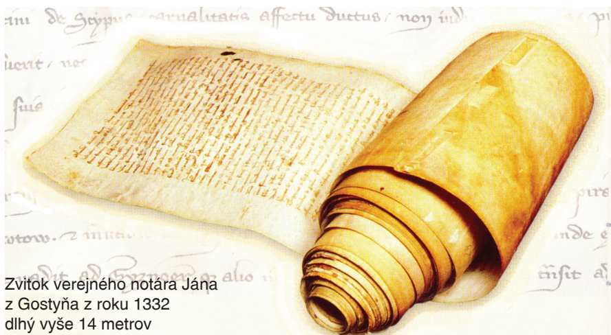
Zvitok verejného notára Jána z Gostyňa z roku 1332 dlhý vyše 14 metrov