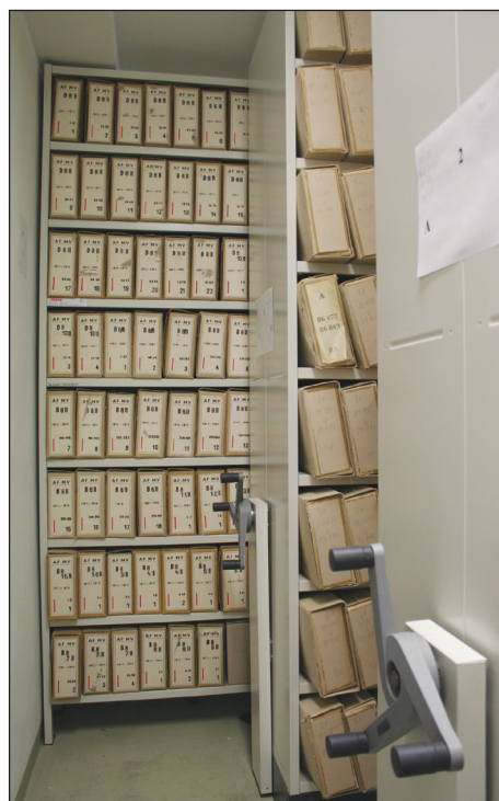
Súbory písomností uložené v posuvných regáloch