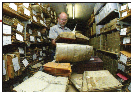
Pohľad do archívu

Nás však veľmi zaujali bohato zdobené a vymalované rodostromy s rodovými erbami – znakmi významných a bohatých šľachtických rodov z minulosti. Rodostromy sú vlastne rodokmeňe znázornené ako rozkošatený strom. Z nich sa dozvedáme nielen mená predkov a kedy žili, ale v stručnosti aj ich statočné činy a úspechy v živote. „Pozrite sa, akých mám predkov! Preto som taký aj ja a moje deti,“ chválili sa nezriedka tí, ktorí si rodostrom nechali vypracovať. Takisto dnes je zaujímavé vedieť, kto boli a ako žili naši predkovia. Preto mnohí pátrajú v rodinných pamiatkach, pýtajú sa starších príbuzných alebo hľadajú zápisy v archíve či v matrikách. Takto si zostavujú rodostrom vlastnej rodiny.